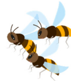
die fleißigen Bienen

Wir gehen auf Foto-Safari, bearbeiten unsere Foto-Ergebnisse, erstellen Collagen und werden unsere Ideen für eine klimaneutrale Welt gemeinsam künstlerisch umsetzen und im Museum ausstellen. Sei Teil der Veränderung und werde ein*e Changemaker*in!