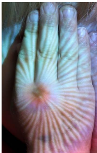
Beispielfoto des Gallus Zentrums

In dem Workshop des GallusZentrums beschäftigt ihr euch mit der Fotografie. Ihr lernt Grundlagen der Fotografie kennen und macht eure eigenen Fotos. Diese werden dann mit einem Beamer auf euch projiziert. Das fotografiert ihr ebenfalls gegenseitig.